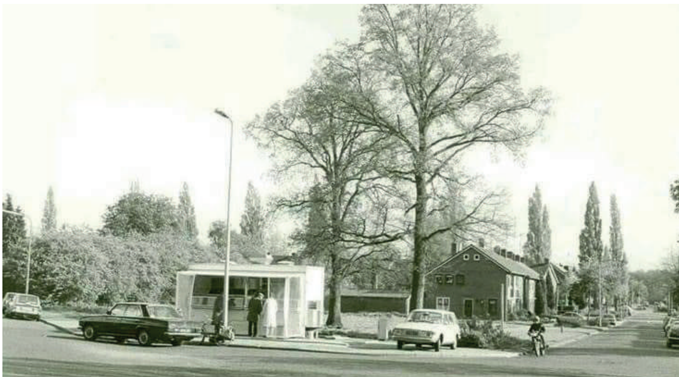
Viskraam hoek Brinkstraat-Malangstraat - omstreeks 1970.