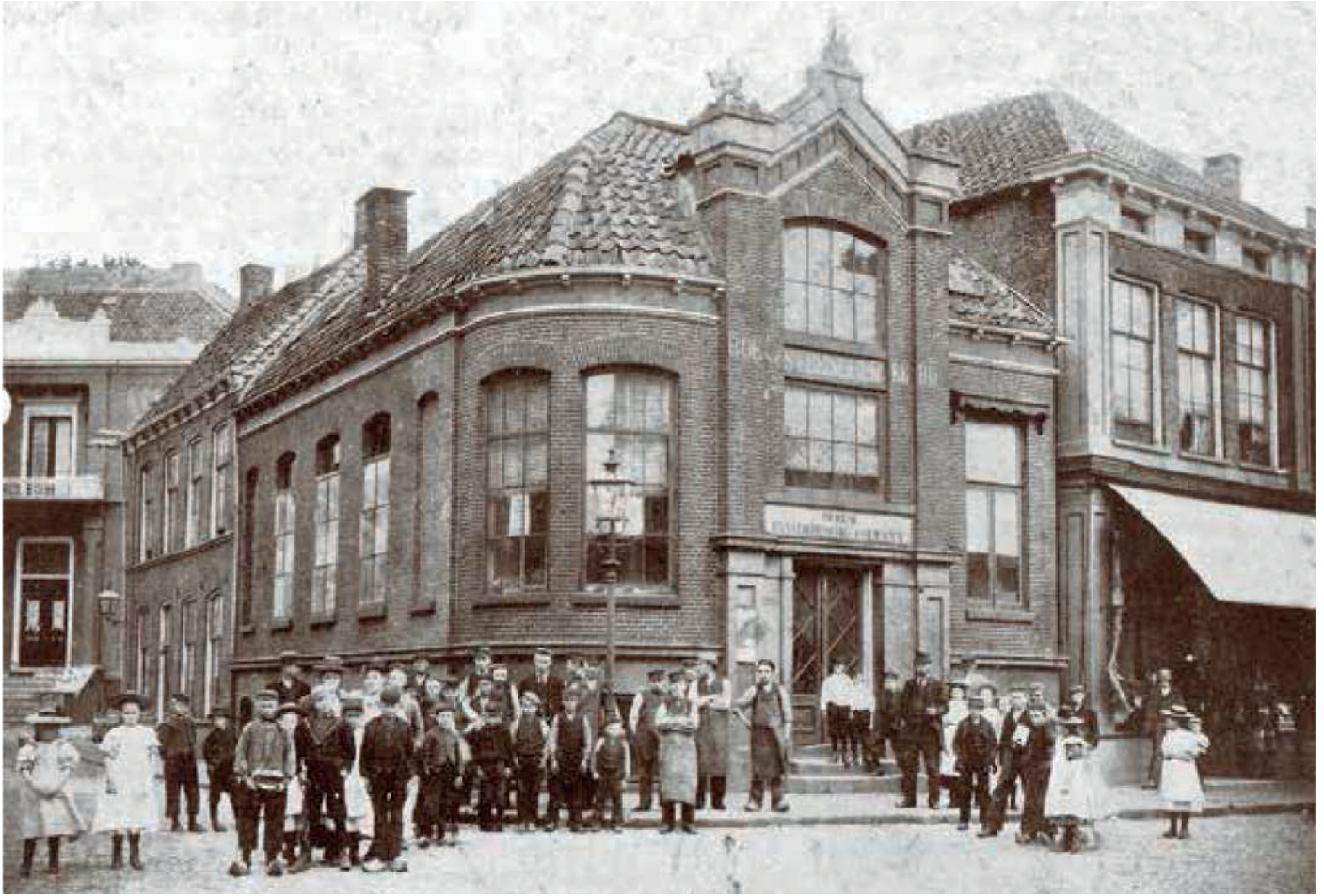
In 1855 kwam de Enschedesche Courant voor het eerst uit. Het kantoor was gevestigd aan de Langestraat naast de Grote Kerk.