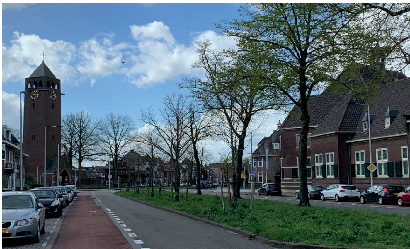
1956 - Lasondersingel